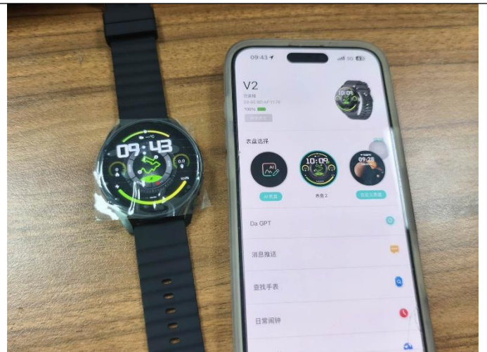
APP 功能测试 (IOS)

检验结果反映了我们在检查时间和地点的发现。本报告不会免除卖方/制造商的合同责任，也不会损害买方对在我们的随机检查中未发现或随后发生的任何明显和/或隐藏缺陷的赔偿权利。本报告未提供装运证据，客户需要在发货前进行最终批准。未获得本公司书面批准，本文件不得进行复制，全文除外。任何未经授权对报告内容及形式进行的修改、伪造或扭曲都是违法行为，违法者将会被追究法律责任。