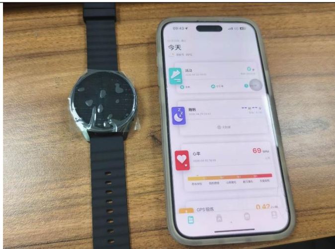
APP 功能测试 (IOS)